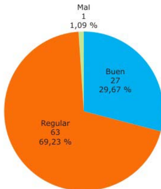
Fig. 2. Evaluación del método de estudio por el estudiante.

En estos resultados sobre método de estudio, al cumplir con el análisis del indicador "condiciones", fue encontrado que en 66 de ellos es calificado de buenas condiciones de los 91 que constituyeron la muestra. En esos 66 están incluidos 36 de los que su familia clasifica como funcional. El resto de este grupo (3) y la totalidad de los del grupo "moderadamente funcional" (52) evaluó las condiciones como malas.