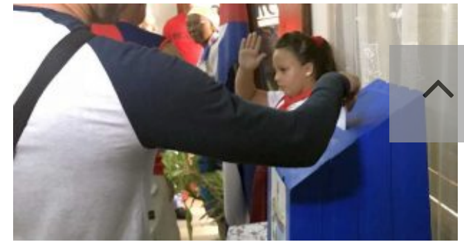
¿Por qué es necesaria una nueva Ley Electoral en Cuba?