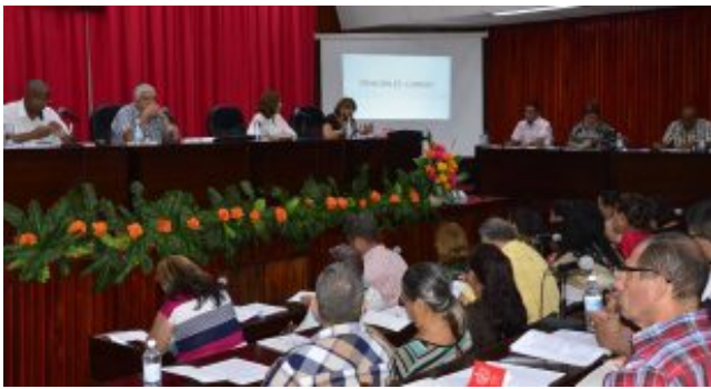
Sancti Spíritus: Diputados del centro de Cuba analizaron proyecto de Ley Electoral (+fotos)