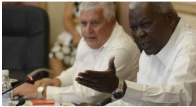
Presentan a diputados cubanos Proyecto de Ley Electoral