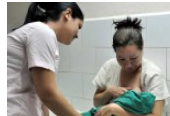
Consolidan en Las Tunas indicadores del Programa Materno-Infantil