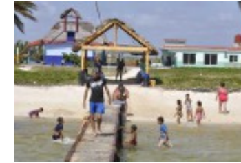
¿Inofensivos?, amores de verano...