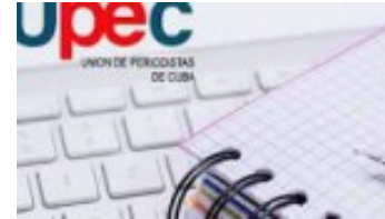
Celebran en Las Tunas aniversario 56 de la UPEC