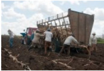
Azucareros de Las Tunas ante un gran reto en siembra de caña