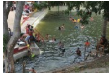
Confort, tranquilidad y belleza a disposición de los azucareros