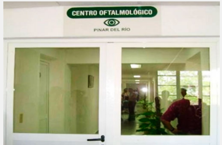
Sesiona en Pinar del Río VIII Taller Nacional de uveítis e inflamaciones oculare...