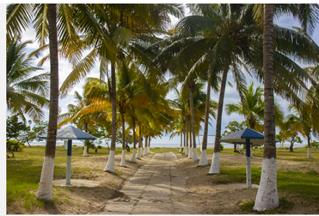
Playa Bailén, un destino para no desechar