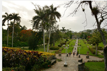
La Güira, paraíso verde de Pinar del Río