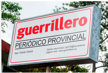
Letreros de mi ciudad