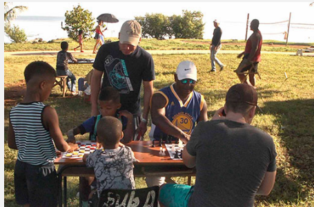
Por un mayor disfrute del verano en Pinar del Río