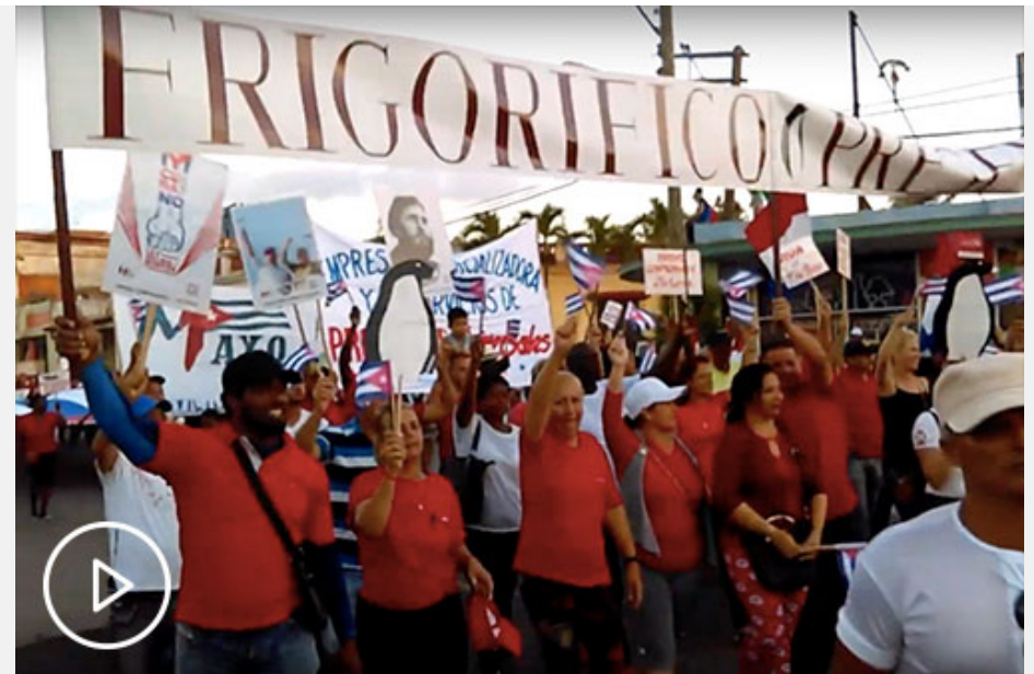
Primero de Mayo en Pinar del Río, Cuba, 2019