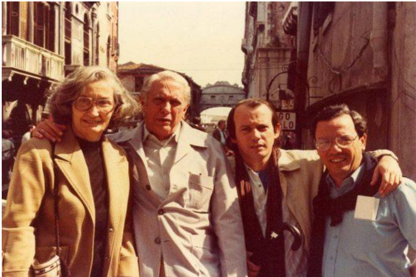
Junto a su esposo, el también poeta y ensayista, ya fallecido, Cintio Vitier, Silvio Rodríguez y Eusebio Leal.

Temas tan universales como la muerte en la evocación de personas que, ya convertidas en iconos de la cultura cubana o de humilde transcurrir en la vida de la escritora, constituyen una suerte de fotografías interiores trazadas con la maestría de la que es, en mi opinión, la más grande de las escritoras vivas cubanas.