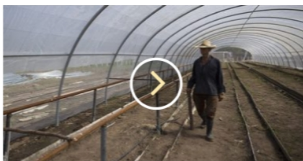
Preparan en Pinar del Río siembra de tabaco