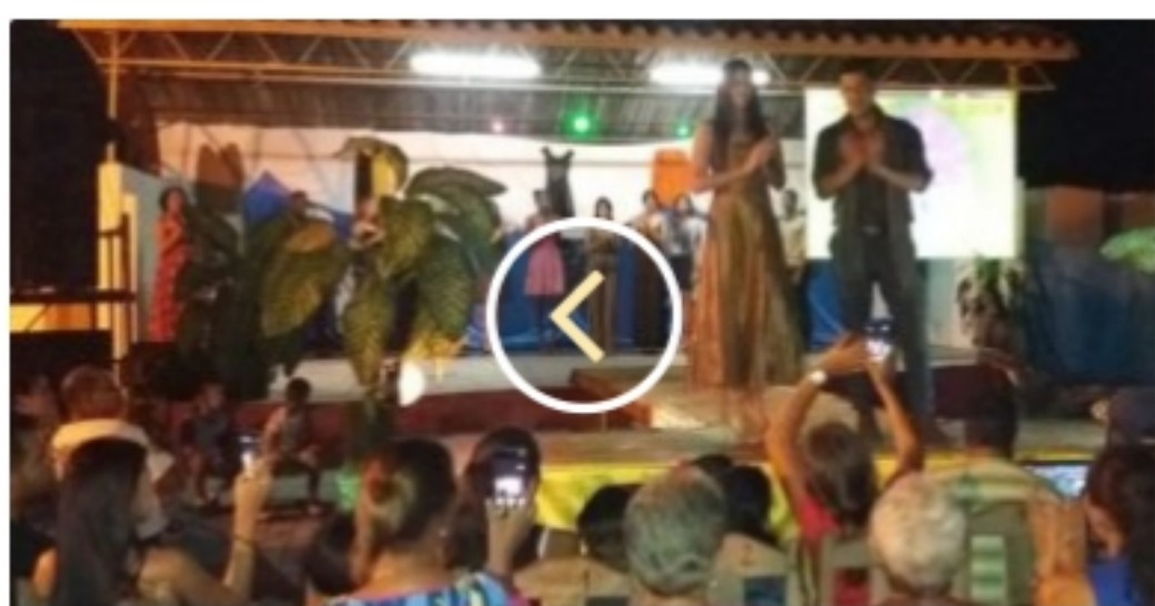
Realizarán hoy sábado 3ra edición del Festival Sandino Modas en el extremo más occidental