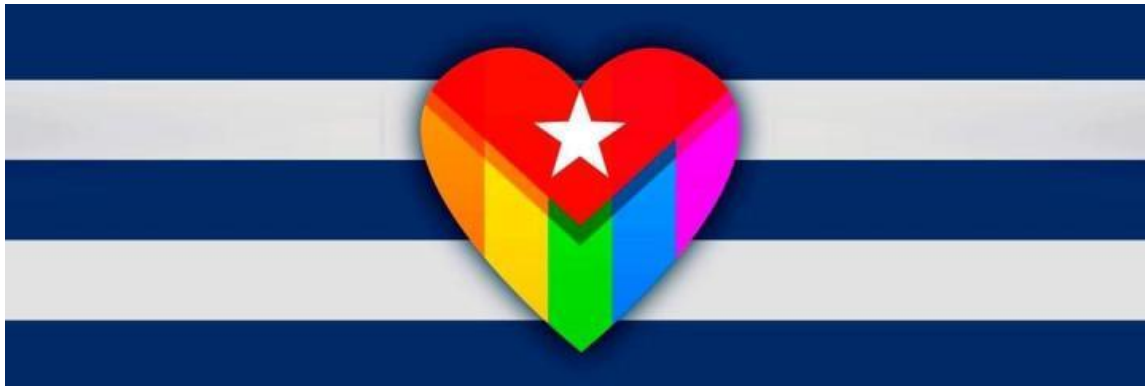
Logo del debate