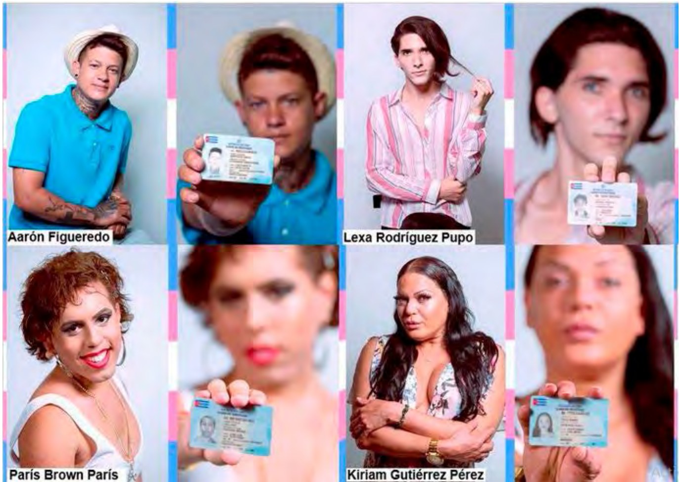
Collage realizado por el fotógrafo Claudio Peláez Sordo, con motivo del Día Internacional de la Visibilidad Trans en 2021.