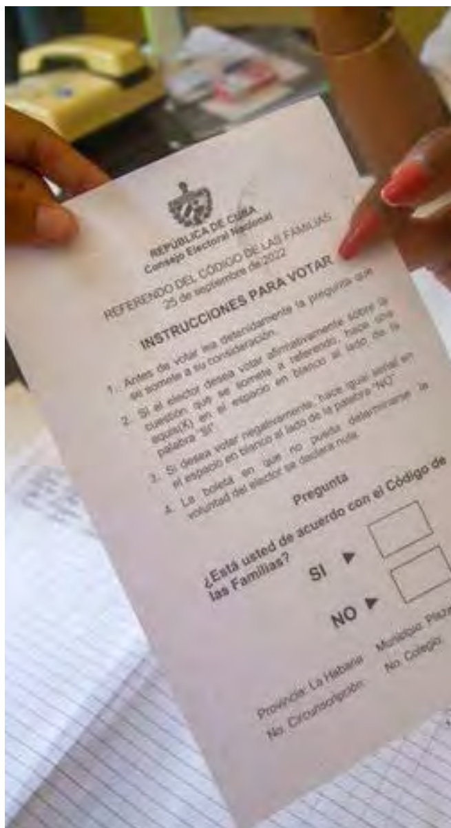
La isla caribeña se pronunció el domingo 25 de septiembre de 2022, en referendo popular, sobre el nuevo Código de las Familias.

Desde la aprobación en referendo popular e inmediata entrada en vigor del nuevo Código de las Familias, el 25 de septiembre, grupos de activistas y personas de la ciudadanía celebran en redes sociales derechos ganados con la nueva norma.