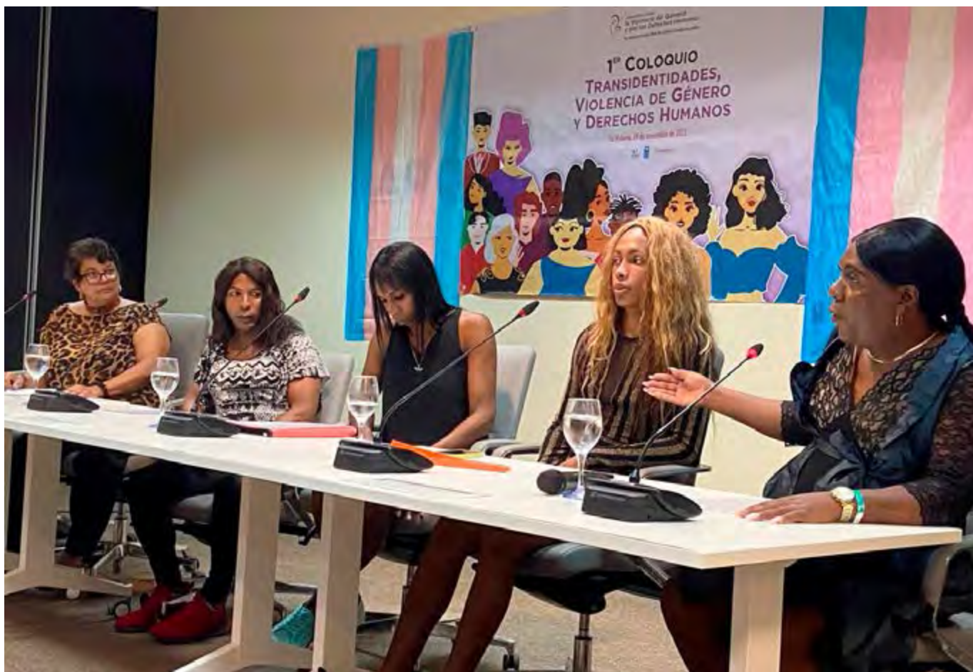
El panel “Privación de libertad y extinción de la sanción, desafíos para la integración social de las personas trans”, desarrollado como parte del Coloquio Transidentidades, violencia de género y derechos humanos el 29 de noviembre de 2022, remarcó la urgencia de ver la inserción social en clave de prevención.