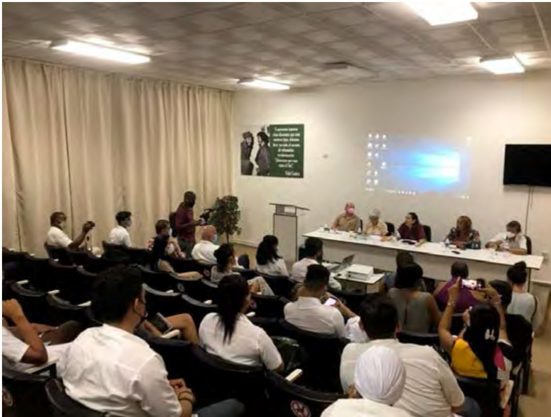
El panel "Atención integral a personas trans en los servicios de salud: antecedentes, avances y desafíos" tuvo lugar en la Facultad de Ciencias Médicas General Calixto García como parte de la Jornada Cubana contra la Homofobia y la Transfobia.

Se necesita mucho acompañamiento y respeto, que se les pregunte cómo se reconocen y les llamen por su nombre, independientemente de cuestiones legales, acotó.