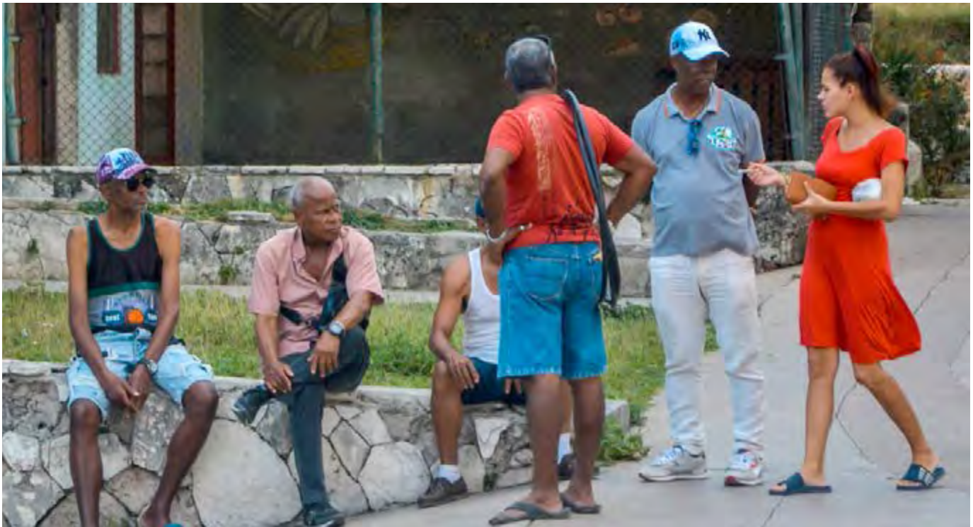
Una cultura patriarcal muy naturalizada y la escasa cultura jurídica de la población atentan contra la prevención de las violencias machistas.

mica, las manifestaciones violentas o discriminatorias en todos los ámbitos de la sociedad.