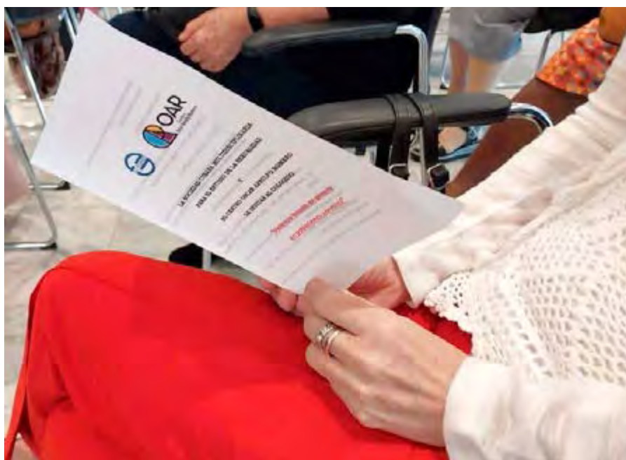
Convocado por la Sociedad Cubana Multidisciplinaria para el Estudio de la Sexualidad y el Centro Oscar Arnulfo Romero, el coloquio contó además con el apoyo del Fondo de Población de las Naciones Unidas.