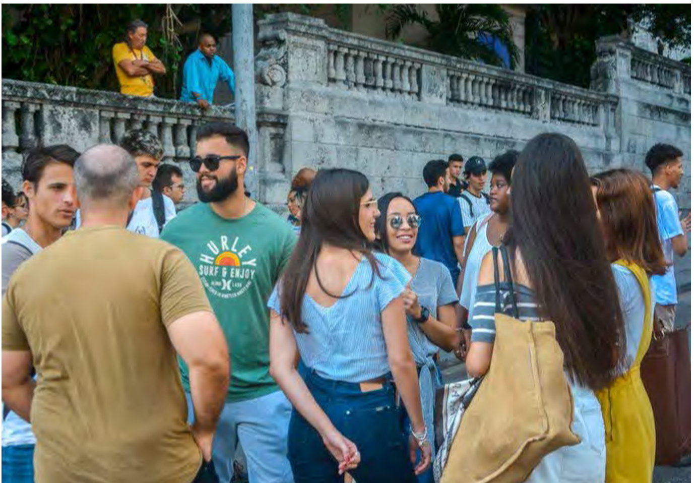
La investigación incluyó a estudiantes de diferentes facultades de la Universidad de La Habana y las de Ciencias Pedagógicas “Enrique José Varona” y de Ciencias Médicas “Victoria de Girón”.

“Se identifican casos de mujeres para quienes la violencia de género